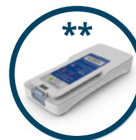
BATTERIA 3 ORE (8 CELLE) RICARICABILE