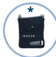
BORSA A TRACOLLA