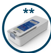
BATTERIA 6 ORE (16 CELLE) RICARICABILE